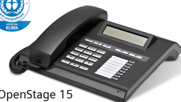
OpenStage 15 Lava