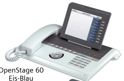
OpenStage 60 Eis-Blau