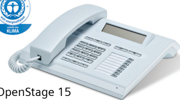
OpenStage 15 Eis-Blau