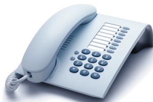
OpenStage 5 Eis-Blau