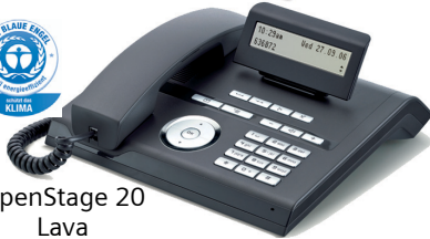
OpenStage 20 Lava