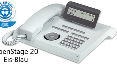
OpenStage 20 Eis-Blau