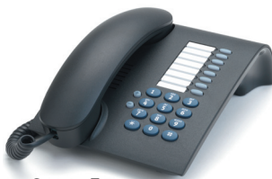
OpenStage 5 Lava