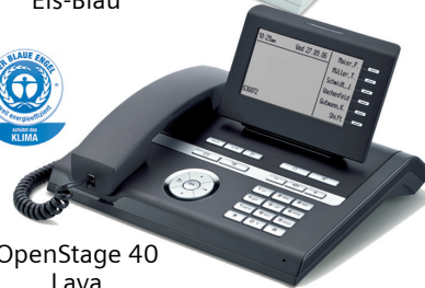
OpenStage 40 Lava