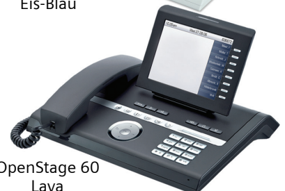
OpenStage 60 Lava