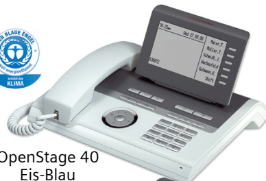
OpenStage 40 Eis-Blau